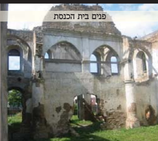
פנים בית הכנסת