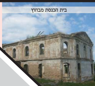
בית הכנסת מבחון

בהיותו בן י"ב נתיחם מאביו הגדול זי"ע (שנסתלק באיבו ביום י"ט ניסן תקל"ב) או אז אספו תלמיד אביו רבינו מרן הרש"ק זי"ע אל ביתו וגידלו וטיפחו כאב ממש, האציל עליו מהודו וקדושתו ופתר לו את כל ספיקותיו ועניניו, וכפי שמרן הס"ק בעצמו התבטא פעם, שהיה נחשב אצלו כאביו ורבו, ונתקשר אליו בעבותות אהבה עזה שימשו בשימוש חכמים, וקיבלו אף במורא כרבו מובהק, ורבינו מרן הרש"ק מצידו השגיח עליו כעל בבת עינו, וממש לא מש ידו מתוך ידו ולא זז מחבבו, כפי שסיפר הרה"ק ר'