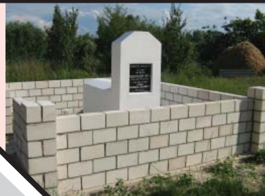
ציון הרה"ק רבי מרדכי מלעכוויטש זצוק"ל בעיר סטולין שבבלארוס