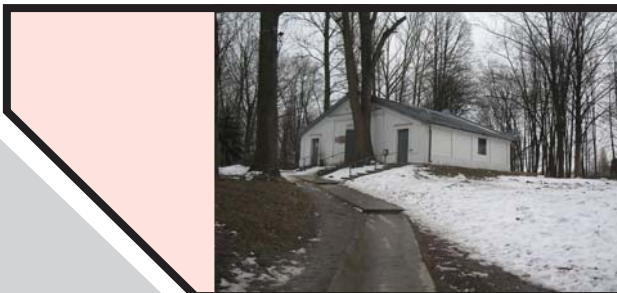
האזהל שעל ציון רבינו הקדוש הרבי ר' אלימלך מליזענסק זי"ע

והנה בספר 'דרך שיחה' ע"ס פרשיות התורה חלק א' 'משולחנו של רבינו הגאון