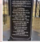
התשובה לגליון קדושים 78 - גליון 78

התשובות מתקבלות בקו לודמיר 22-111-30-02 שלוחה 0