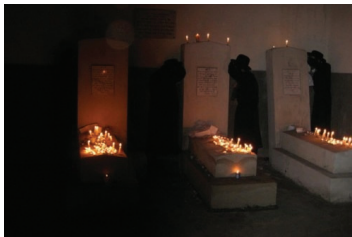
ציון קדשו של הרה"ק רבי מרדכי מנעשכזי צוק"ל

בקשו הם להציל מפי המשמש אודות מה שאירע, אולם אביהם הרבי הקדוש עצר בעדם, "אל נא. אל תציקו לגבאי בשאלות, כי עוד מעט, כשנגיע לישולחן עורך", אספר לכם הכל!..."