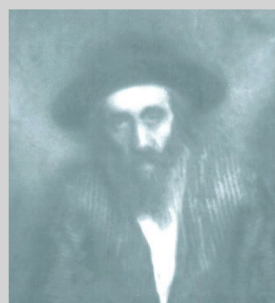
הרה"ק רבי אהרן ראטה בעל השומרי אמונים צוק"ל

לרגל הילולת הרה"ק רבי אהרן ראטה בעל 'שומרי אמונים' זי"ע, הוננו להביא את החוט המקשר בינו לבין מרן רבינו ר' שלמה מקארלין. בשנת תרע"ד בעת מלחמת העולם הראשונה נמלט הרה"ק רבי אהרן לעיר פעסט שבהונגריה, שם נפגש עם הרה"ק רבי אברהם לאנגער מקנהעניטש, וחסה בצל קדשו בימי הפסח ועוד. הרה"ק רבי אברהם קרבו מאוד, והושיבו בראש השולחן בליל הסדר, ועירב את השיריים שלו עם השיריים של רבי אהרן שהיה אז צעיר לימים.