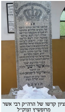
ציון קדשו של הרה"ק רבי אשר מרופשיץ זצוק"ל

קפץ רבי שלמה זלמן ממקומו בהתפעלות ואמר לחייט: "הרב מרופשיץ רוצה להשתדך עמך ואתה שוקל בדעתך?! הלוואי והיה לי בן כבונן והרב מרופשיץ היה מציע לי את השידוך!..." חזר החייט במרוצה אל ביתו, לבש בגדי חג, לקח את אשתו ואת פניהם אל אכסניית הרב מרופשיץ, להודיע לו שהם מוכנים ומזומנים