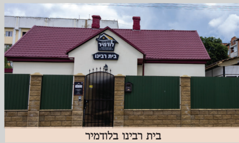
בית רבינו בלודמיר

בימים אלה, נערכו עבודות נקיון יסודיות באגפי בית רבינו השונים לקראת חג הפסח, במהלכן נוקה כל המתחם מכל שיירי מאכלי חמץ. על המלאכה פיקח ידידנו עוז מפעילי בית הכנסת אורחים' לודמיר, המסור בכל עת למען שגשוג ופריחת מפעלות רבינו שלמה מקארלין ז"ע, הלוא הוא ר' יהודה זילברמן הי"ו, הדובר את השפה האוקראינית ומפעיל ביד רמה את הפועלים המקומיים.