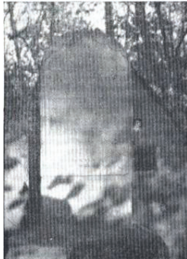
ציור קדשו של הרה"ק רבי אהרן הגדול זצוק"ל בקארלין