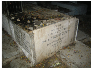
ציון קדשו של הרה"ק רבי יעקב משפיטובקא ז"ע בבית החיים בטבריה

אשר יוציא להורג חס ושלום את האורחים, ומי יקבל את סך הכסף הגבוה ביותר... לחרדתם הרבה, הבינו הצדיק ומלווהו, כי נפלו בפח יוקשים של כנופיית רוצחים וגזלנים, הזוממים ליטול את חייהם ואת ממונם גם יחד. עתה גם נתחורר להם כי בעל המלון שהפנה אותם הלום, שותף אף הוא לכנופיית המרצחים.