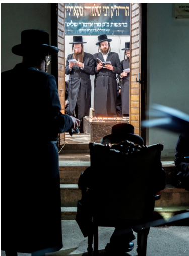
כ"ק אדמו"ר מטשערנאביל שליט"א, מוחץ לציון הקדוש בלודמיר

ואכן, כך נסענו, הרבי והחסידים ללודמיר. המסע היה מרומם ומיוחד בצורה יוצאת דופן. התפילות, הבכיות