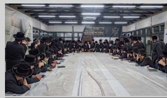
כ"ק אדמו"ר מטשורנוביל שליט"א בלחיים טיש ב'דעם רבינס זאל'

לקראת היארצייט משלימים את כל עבודות בניית ההיכל, ובעזרת ה' ביום היארצייט תתקיים חנוכת הבית ברוב פאר והדר.